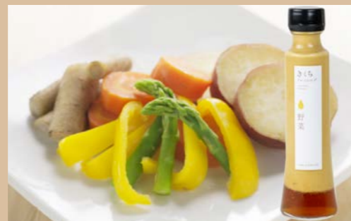
No.11 ドレッシングセット

たまねぎ、大根、トマト、パプリカ、にんじん、ごぼう、生姜、にんにくなどのお日さまをたっぷり浴びて育った熊本県産野菜のおいしさがギュッと凝縮した元気野菜ドレッシングです。内容: きくちドレッシング(野菜)150ml×2本