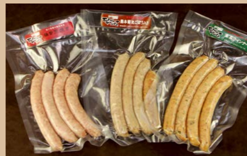
No.12 ウィンナーセット

自家製ハム工房おすすめ TONGTONG ウィンナーソーセージです。SPF 養豚という健康でストレスの少ない美味しい豚をより多く出荷できる養豚法を採用しています。内容: 4本入り ×3袋(粗挽き、ごぼう、高菜など)