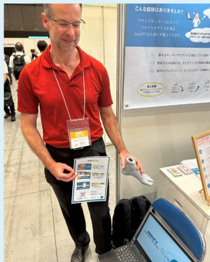
足計測アプリ紹介の様子

ブースでは、当社とNWCが共同開発を行っている、AR技術を用いたスマートフォンで足の測定が可能な「足計測アプリ」をデモンストレーションを交えてご紹介いたしました。期間中には多くのお客様に実際に開発技術を見て体験いただくことができ、大変良い機会となりました。お立ち寄りいただき、誠にありがとうございました。